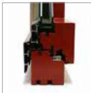
Décalé (voir ci-contre)